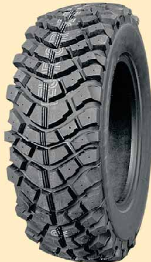
MUD POWER CHIODABILE